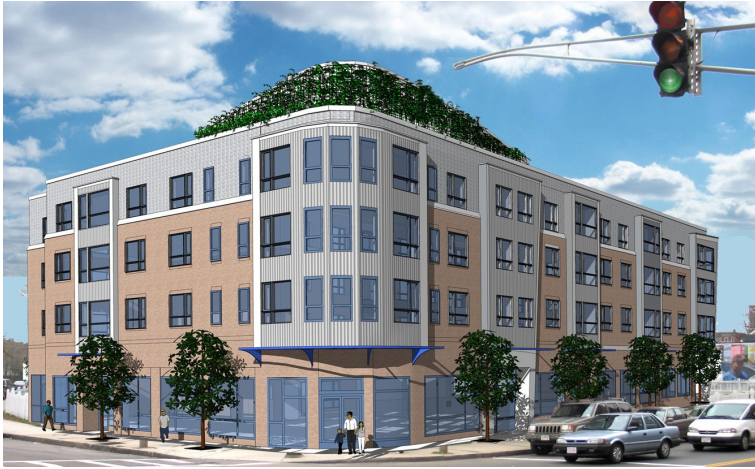
Interpretación Artística de 270 Centre, © Studio G Architects

Nueva Construcción — espacios disponibles de 900, 1500, o 1000-3000 PC