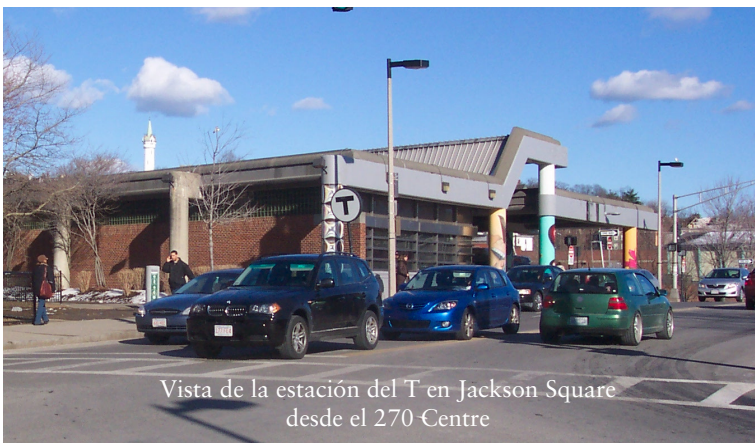
Vista de la estación del T en Jackson Square desde el 270 Centre